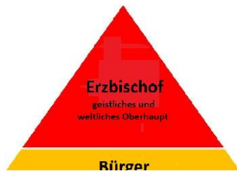
Köln unter geistlicher Herrschaft 953 - 1288

Nicht jeder Kölner war im Mittelalter ein Bürger der Stadt Köln. Als Bürger hatte man Mitspracherechte, musste aber auch Pflichten erfüllen. Welche Rechte ein Mensch wirklich besaß, hing von seinem Besitz und Ansehen ab. Die Wehrpflicht war eine allgemeine Bürgerpflicht. Kam es zum Krieg, mussten die Bürger die Stadt mit ihren eigenen Waffen verteidigen und in Friedenszeiten an der Befestigung der Stadtmauer mithelfen. Steuern mussten sie auch abgeben. Jeder Bürger musste einen Schwur ablegen und Geld an die Stadt zahlen. Neben den Bürgern gab es sogenannte Nichtbürger. Sie waren nicht reich genug, um das Bürgerrecht zu erwerben. Trotzdem mussten sie Wehrpflicht leisten und Steuern zahlen. Als Nichtbürger hatte man es schwer, in einer Gilde oder Zunft aufgenommen zu werden oder politische Rechte zu bekommen. Frauen konnten das Bürgerrecht nicht bekommen.