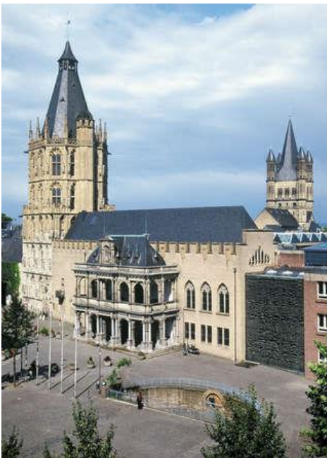
Das Rathaus von Köln, Foto: Stadt Köln

Der älteste Teil ist der Saalbau, das Gebäude mit den spitzen Fenstern. Es sieht wie eine Burg aus. Um dem Erzbischof ihre wachsende Macht zu zeigen bauten die Kölner an das Rathaus den Ratsturm. Dieser erinnert an eine Kirche und war im Mittelalter genau einen Meter höher als der unfertige Dom. Jeder der nach Köln kam sah, dass das Rathaus der Bürger „größer“ war als die Kathedrale des Erzbischofs. Erst viel später, im 16. Jh., wurde die Rathauslaube an den Saalbau angebaut. Dieser besondere Balkon wurde mit Bildern geschmückt, die jedem der vorbeigeht die Stärke der Bürger zeigen. Ganz oben steht Justitia, die Gerechtigkeit, mit ihrer Waage.