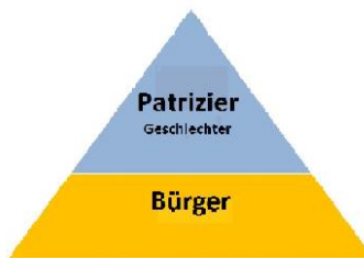
Herrschaft der Geschlechter 1288 - 1396